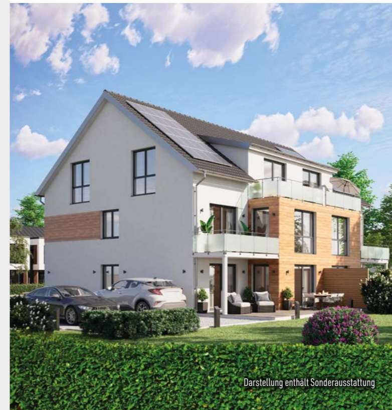
Darstellung enthält Sonderausstattung