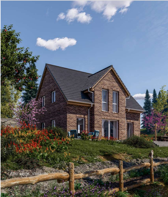
Abb. zeigt Variante