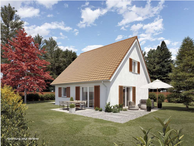
Abbildung zeigt Variante

Zimmer: 3,00 Wohnfläche ca.: 70,00 m 2 Kaufpreis: 313.252,00 EUR